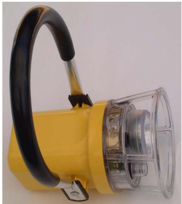
Figure 4. 使用 SILVERLED-1N6V 的手电筒实物照片