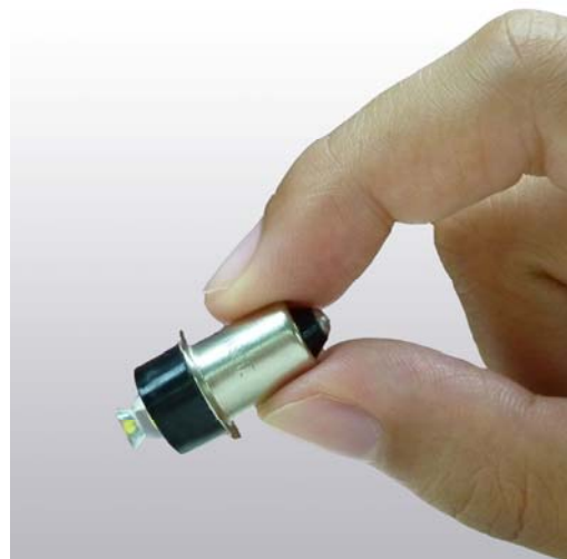
图 1. SILVERLED-1N6V 的实物照片